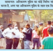
समानत: अतिक्रमण मुहिम का विरोध नहीं करता है, अगर वह अतिक्रमण मुहिम के तहत एक एक सत्रि

अतिक्रमण मुहिम का विरोध नहीं पर मुहिम के नाम पर चांदी करते जाने का विरोध