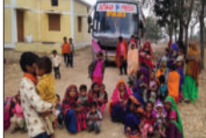
चड़ड़ रिएर जाते हैं। कई बार दुर्घटनाएं हो जाने के बावजूद भी शासन-प्रशासन उपरलसी बना हुआ है।

जो जानकारी मिली उसके मुताबिक बस को कायमता तथा क्षमता से अधिक सवारियों के कारण जब्त करवा दिया गया।