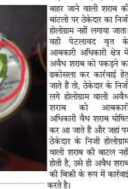
आबकारी पुलिस ठेकेदार के साथ बहस कर रहा है कि वह शराब पर लगे निजी होलोग्राम जैसे आबकारी ठेकेदार नहीं करती है कार्रवाई।

मुख्य की प्राथमिकता देकर एजेंट के यहाँ बाहरी क्षेत्र की ही शराब होना बावजूद आबकारी अधिकारी पर ठेकेदार व गुर्गों आगे लाकर कहा जाता है, साथ वहा बड़ी मात्रा में शराब मिली होगी पर आपकी वहाँ से अवैध शराब मिल गया होगा, इसलिए अपने कार्रवाई नहीं की और आप इसे संभालें और कार्रवाई कर रहे हैं। आबकारी शिकायत उच्च अधिकारी को करे।