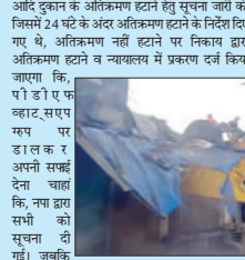
से व सफाई रूप से छोटे अतिक्रमण हटाने के साथ सत्ता कार्रवाई कर सभी उर रखवहन के भी अतिक्रमण हटाए, जो अपने प्रभाव या अतिक्रमण हटाने को मुहिम का डबसेसला करते वाले अधिकारियों को मोदी रहम

आदि दुकान के अतिक्रमण हटाने हेतु सूचना जारी की जिसमें 24 घंटे के अंदर अतिक्रमण हटाने के निर्देश दिए गए थे, अतिक्रमण नहीं हटाने पर निष्काय द्वारा अतिक्रमण हटाने व न्यायक्षेत्र में प्रकरण दर्ज किया जाएगा कि, पी डी ए ए ब्लाट, रायपुर रफा पर डाल कर अपनी सफाई देना चाहे कि, नया दाय रफी को सूचना दी गई। जबकि उक्त सूचना दिनांक से 24 घंटे की समावधि खत्म होने के तीन-चार तक की ओसी प्राप्त है, पर में दर्शा रहे है। लेकिन चढ़ा सफल वह है कि, जब डेढ़ माह पूर्व प्रशासन ने नोटिस 24 घंटे के अंदर अतिक्रमण के साथ कुछेक को सूचना दी तो दिए गए समावधि के दौरान अतिक्रमण क्यों नहीं हटया गया?